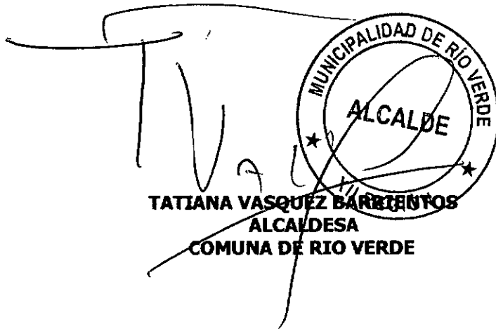
TATIANA VASQUEZ BARRIENTOS ALCALDESA COMUNA DE RIO VERDE